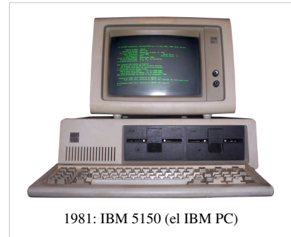
1981: IBM 5150 (el IBM PC)

IBM respondió al éxito del Apple II con el IBM PC, lanzado en agosto de 1981. Como el Apple II y los sistemas S-100, estaba basado en una arquitectura abierta basada en tarjetas, que permitía a terceros desarrollar en ella. Usaba el CPU Intel 8088 corriendo a 4,77 MHz, que contenía 29.000 transistores. El primer modelo usaba un cassette de audio para almacenamiento externo, aunque había una costosa opción de disco floppy. La opción del cassette nunca fue popular y fue removida en el IBM XT de 1983. [11] El XT añadió un disco duro de 10 MB en el lugar de uno de los dos discos floppy e incrementó el número de slots de 5 a 8. Mientras que el diseño original del PC podía acomodar solo hasta 64 KB en la tarjeta madre, la arquitectura era capaz de acomodar hasta 640 KB de RAM en total, con el resto en tarjetas. Versiones posteriores del diseño incrementaron el límite a 256 KB en la tarjeta madre.